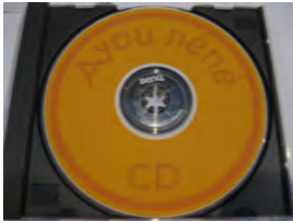
CD Ayou Néné