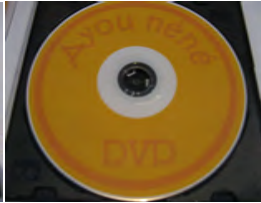
DVD Ayou Néné