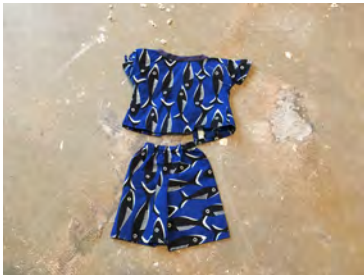
Senegalese kleren voor de baby (boeboe en broek)