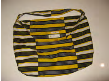
Opbergentas voor kledij